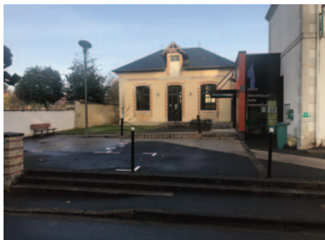
Vue extérieure Mairie et Salle des Associations

Il ne faut pas oublier le point lecture (en page 11).