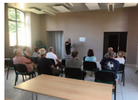
Réunion d'information des riverains de la RD 42

C'est l'aboutissement des engagements municipaux au service de tous