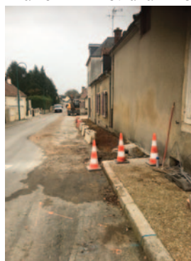
RD 7 Travaux du syndicat d'eau