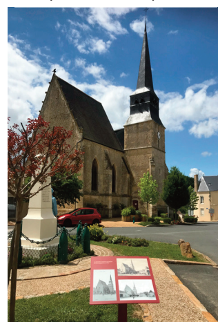
Un des pupitres installé place St Denis