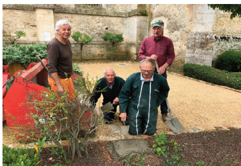
La réalisation des supports de béton

Notre Comité du Patrimoine présente à juste titre cette opération comme une invitation à remonter le temps : n'hésitez pas à la saisir et à en faire profiter un maximum de visiteurs de notre commune.